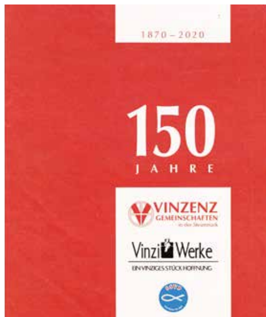
Die Festschrift zum 150jährigen Bestehen der Vinzenzgemeinschaften.

Immerhin ist diese katholisch-karitative Organisation nach deren Auflassung während des Zweiten Weltkrieges wieder auferstanden und hat sich gerade in den danach folgenden Krisenzeiten mit Hilfseinsätzen bewährt. Auch in der derzeitigen