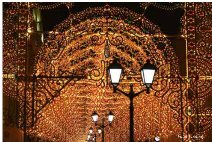
Wer kennt sie nicht – die Beleuchtung zu Weihnachten?

Annemarie Gratzl (AK „Schöpfungsverantwortung“)