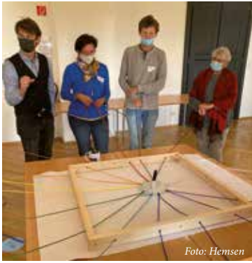
An einem Strang ziehen, in einem Boot sitzen - viele Symbole trugen zum Team- building-erfolg bei.

Ein Boot auf hoher See mit allen anwesenden Personen zu zeichnen, war der erste Auftrag als Team an diesem Tag. Klingt sehr einfach, erforderte jedoch gleich volle Konzentration, den richtigen Blick, konkrete Anweisungen, ein Maß an Gespür und Einfühlungsvermögen. Eine Zeichnung zu fertigen mit einem Stift, der schwebend über dem Papier, an Seilen fixiert und nur durch Hin- und Herziehen von uns gesteuert wurde, war eine große Herausforderung, die aber gleich zu Beginn sehr viel Spaß gemacht hat!